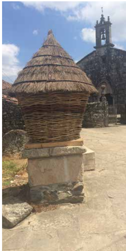
Pinceladas de un pequeño poblado gallego.

Este 2021 es Año Santo Jacobeo (este calificativo es empleado para referirse a todo aquello que tiene que ver con la temática del Apóstol) y, de manera excepcional por la pandemia que vive el mundo, se ha proclamado que 2022 también lo sea, aunque no se cumpla la coincidencia de la fecha con el domingo.