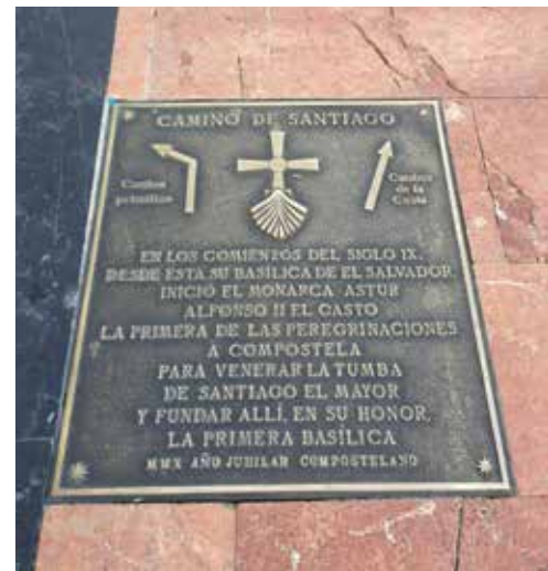
El punto de partida del Camino primitivo.

Santiago Apóstol es el patrón de España y su santoral se conmemora el día 25 de julio. De acuerdo con la web de la oficina de acogida al peregrino, en 1122